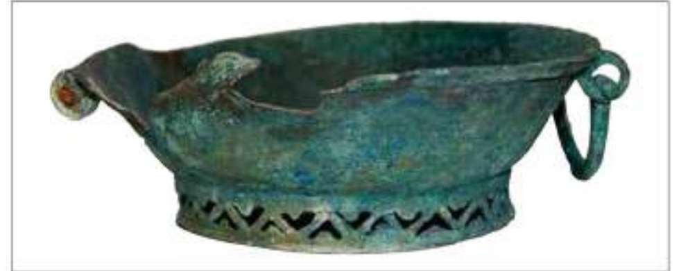
Fig. 26. Momo. Bacile in bronzo fuso, dell'area del ritrovamento.

A fianco: reperti dalla necropoli longobarda di Momo