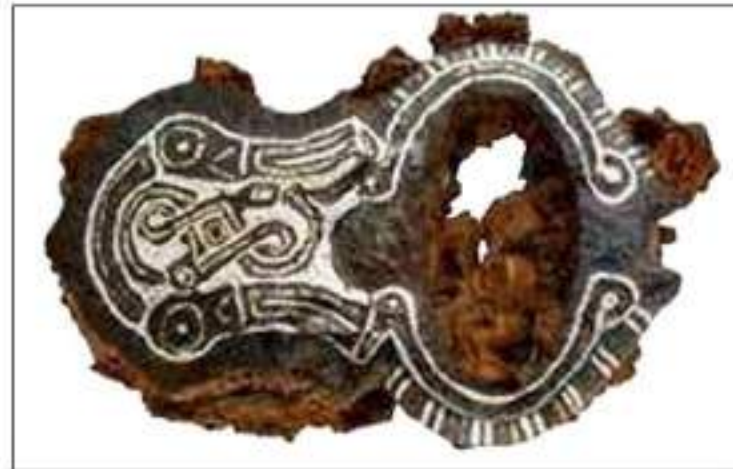
Fig. 25. Momo. Fibbia di cintura ageminata dalla tomba 4.