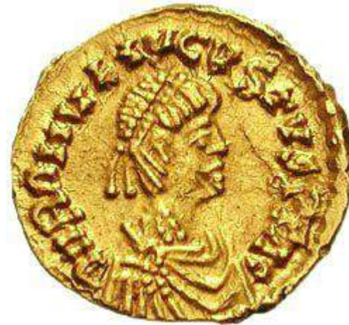
Moneta di Romolo Augustolo e moneta di Odoacre con effigie dell'imperatore Zenone